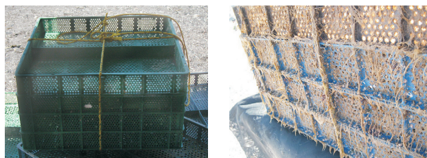
Figura 1. A, módulo limpio listo para ser colocado en el sitio de colecta; B, módulo recuperado después de un mes de estar sumergido en el mar.

Trabajo de campo. El sustrato artificial utilizado fueron canastas plásticas de tipo Nestier, comúnmente conocidas como canastas ostrícolas, debido a su utilización en acuicultura del ostión. Cada canasta presenta una superficie de 1 067 m 2 y aperturas de 1 cm de luz. Se ensamblaron 3 módulos compuestos por 4 canastas ostrícolas (Figs. 1A, B) cada uno y se suspendieron con una boya en las inmediaciones de playa Guadalupe, procurando que permanecieran superficialmente a no más de 3 m de profundidad. Después de un mes, los módulos se retiraron del agua envueltos en una tela plástica con luz de malla de 1 mm para su transporte a la playa. Los módulos se revisaron minuciosamente separando y cuantificando la fauna y los ejemplares colectados se fijaron en alcohol al 70% para su transporte e identificación en un laboratorio.